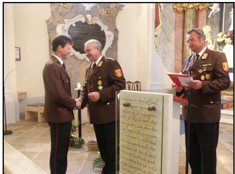
Beim Festakt 120 Jahre FF Wilfersdorf, der wegen Regens in der Pfarrkirche stattfand, wurden auch die Ehrungen der FF Kameraden aus Wilfersdorf durchgeführt