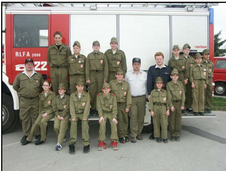
nach dem Wissenstest, der erfolgreich von der FJ Wilfersdorf durchgeführt wurde

Anfang Mai werden wir mit den Feuerwehrkameraden aus Hobersdorf und Bullendorf gemeinsam in Bullendorf das Fest des Hl. Florian feiern.