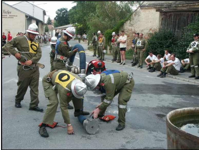
Wilfersdorf 1 bei der Angriffsübung zum Nasslöschbewerb beim FF Heurigen 2004

FF Bullendorf und FF Hobersdorf in Hobersdorf gefeiert. Da die Freiwillige Feuerwehr im Jahr 2004 ihr 120jähriges Bestehen feierte, wurde am 19. Juni der Feuerwehrleistungsbewerb und am 20. Juni der Abschnittsfeuerwehrtag (AFT) des Abschnittes Mistelbach in Wilfersdorf abgehalten. Am 7. und 8. August hielten wir unseren Feuerwehrheiligen mit Nasslöschbewerb beim Feuerwehrhaus ab. Wir danken Allen, die unsere Veranstaltung besuchten, und uns dadurch unterstützten. Im Dezember wurde der Adventmarkt im Schloss Willfersdorf abgehalten, an dem die Feuerwehr ebenfalls teilnahm.