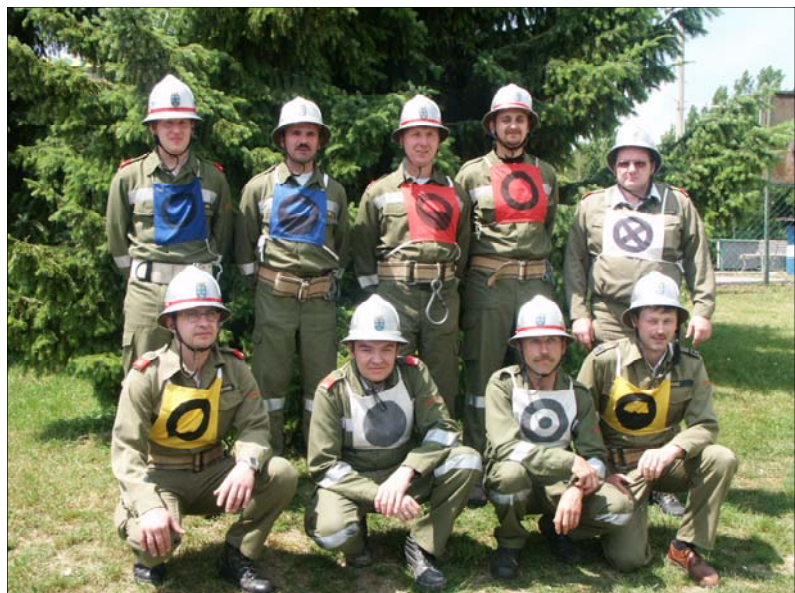
Die Wettkampfgruppe „Wilfersdorf 2“ konnte beim Abschnittsfeuerwehrleistungsbewerb in Wilfersorf in Bronze mit Alterspunkten den 1. Platz erringen

mit Erfolg ablegten. Dieses Leistungsabzeichen besitzen zur Zeit 15 Kameraden in Bronze, 21 Mitglieder in Silber und ein Mann in Gold. Wir gratulieren allen Teilnehmern dazu recht herzlich. Um den Ausbildungsstand zu verbessern, wurden von insgesamt 9 Feuerwehr-