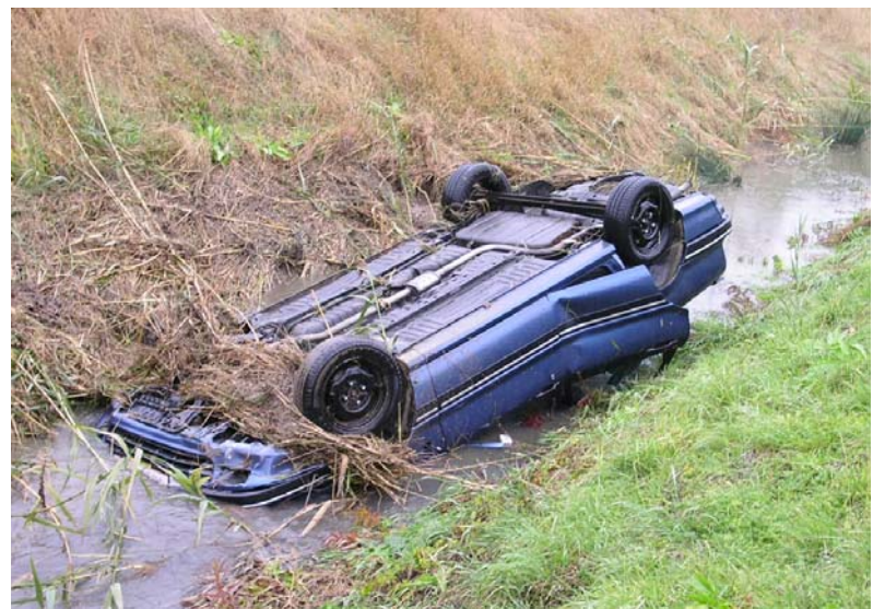
PKW in Kettlasbach gestürzt, Fahrzeug mittels Seilwinde bergen, Fahrer blieb unverletzt

Im vergangenen Jahr stellten wir den Kondukt für drei beitragende Mitglieder und begleiteten sie auf ihrem letzten Weg.