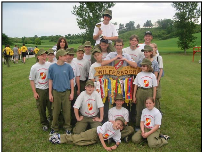
Die Feuerwehrjugend Wilfersdorf in Maustrenk beim Bezirksleistungsbewerb des Bez. Gänserndorf

Als Kommando der FF Wilfersdorf sind wir über die erfolgreiche Nachwuchsarbeit in unserer Feuerwehr sehr erfreut. Im abgelaufenem Jahr konnte die Feuerwehrjugend einen 1. Platz beim Abschnittsleistungsbe- werb in Kottingneusiedl und einen 2. Platz in Maustrenk in der Gästewertung erreichen. Beim Landeslager in Obersiebenbrunn nahm die FJ so wie im Jahr 2002 beim Junior Fire Cup teil (die besten 18 Gruppen treten in einem Parallelbewerb gegeneinander an). Im Juli 2004 wurde die Feuerwehrjugendgruppe Wilfersdorf vom NÖ Landesfeuerwehrverband nach Bad St. Leonhard zum ersten Kärntner Landesleistungsbewerb der Feuerwehrjugend entsandt.