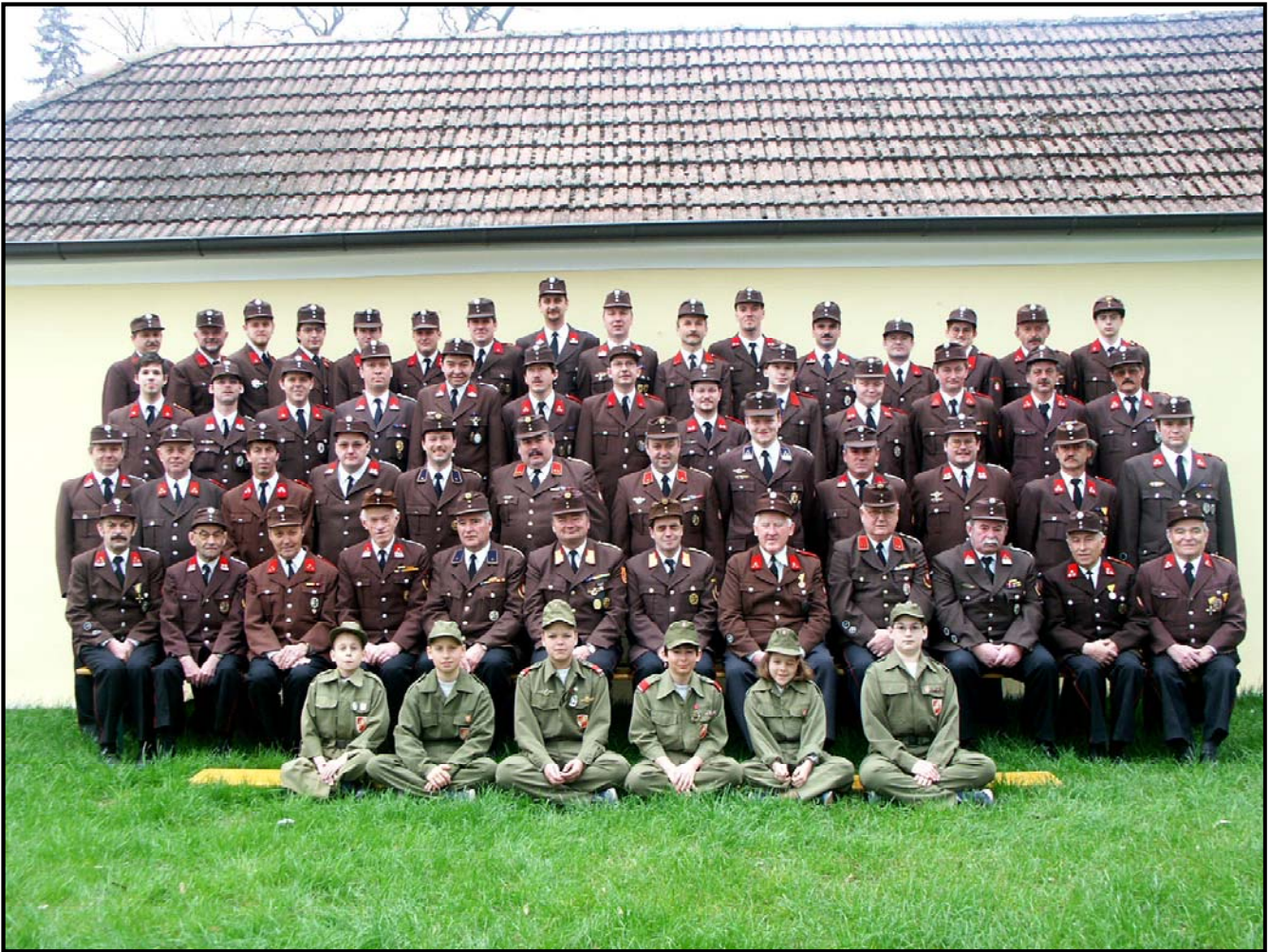
Foto der Freiwilligen Feuerwehr Wilfersdorf zum 120jährigen Gründungsfest