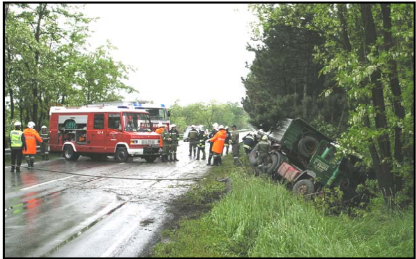
LKW auf nasser Fahrbahn ins Schleudern geraten und über die Böschung gestürzt, B 7 bei Schrick