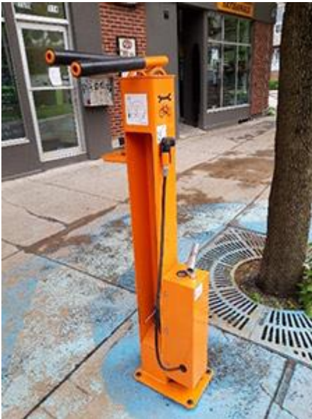
Un poste de gonflage vélos.