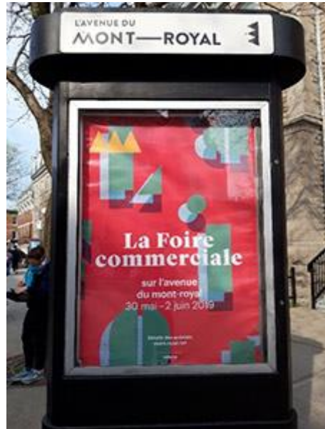
Début de la période estivale.