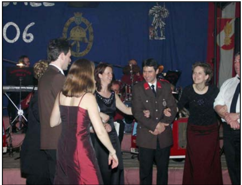
Gute Unterhaltung beim FF Ball 2006

Um die Sicherheit bei Einsätzen für jedes einzelne Feuerwehrmitglied sicherstellen zu können, muss jedes Jahr Einsatzbekleidung neu angekauft oder ersetzt werden. Im Jahr 2006 wurde folgende Einsatzbekleidung angekauft: 6 Schutzhosen der Klasse KS 4 für Atemschutzeinsätze bei Bränden sowie Einsatzhandschuhe und Sicherheitstiefel aus Leder. Weiters wurden im FF Haus neue Garderobekästen eingebaut, um die Einsatzbekleidung jedes einzelnen Feuerwehrmitgliedes sicher und geordnet unterbringen zu können. Um die Einsatzbereitschaft aufrecht erhalten zu können, werden