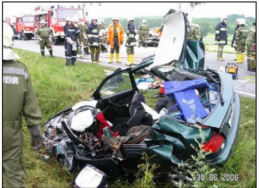
Technischer Einsatz mit Menschenrettung auf der B 7

Im Jahr 2006 mussten die Feuerwehrkameraden von Wilfersdorf zu 24 Einsätzen mit insgesamt 418 Einsatzstunden ausrücken. Um für die Einsätze bestens gerüstet zu sein, müssen sich die Feuerwehrmitglieder jedes Jahr bei Übungen und Lehrgängen weiterbilden. Im abgelaufenem Jahr wurden 36