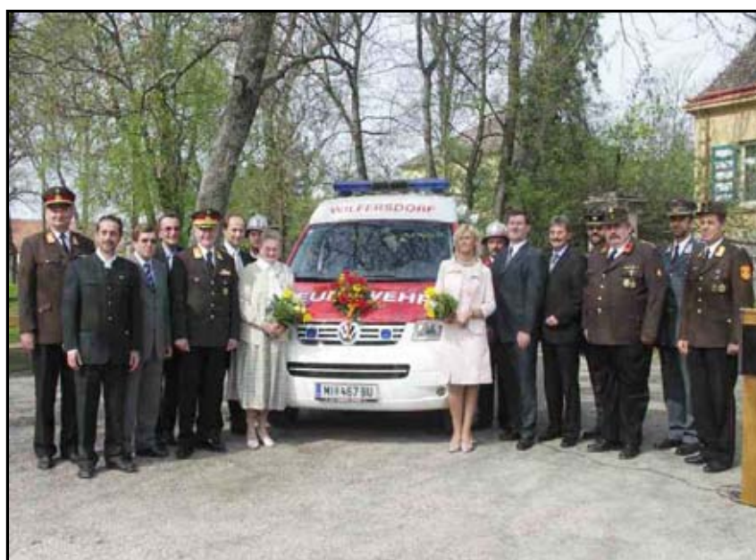
Florianifeier und Fahrzeugsegnung am 23. 04. 2006