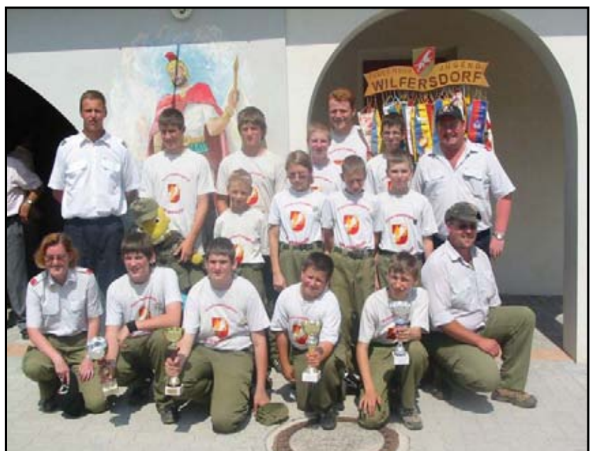
Empfang der Feuerwehrjugend vom Landesbewerb

bekleidung für die Feuerwehrmitglieder, Instandhaltungsarbeiten beim Feuerwehrhaus und betragen im Jahr 2006 ca. € 15.000.-- . Um aber alle Anschaffungen finanzieren zu können, bedarf es auch der Unterstützung der Einwohner von Wilfersdorf. Wir wollen uns für die Spendenbereitschaft im vorigen Jahr recht herzlich bei der Ortsbevölkerung und bei den Betrieben bedanken.