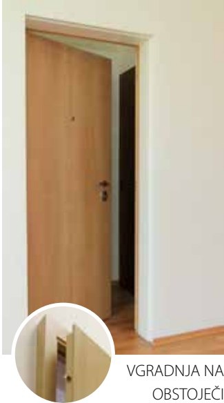
VGRADNJA NA OBSTOJEČI KOVINSKI PODBOJ