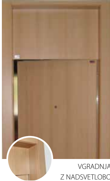
VGRADNJA Z NADSVETLOBO