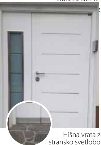
Hišna vrata z stransko svetlobo