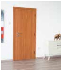
ČEŠJA - TEMNA