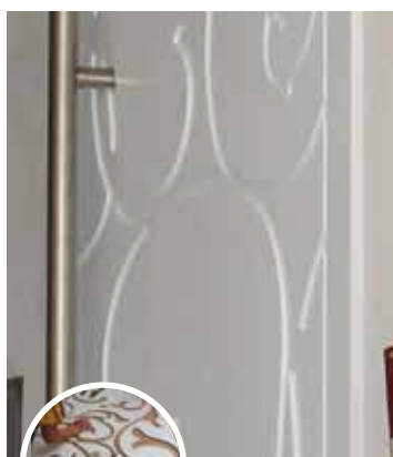
Unikatno zasnovana vrata