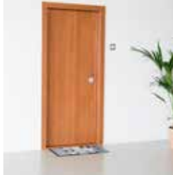
ČEŠJA - TEMNA