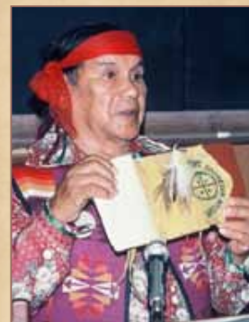
Friedenserklärung der Hopi

Aber auch unter den Hopi gibt es eine steigende Zahl von Assimilierten, die durch Supermärkte, forcierten Fremdenverkehr, durch Straßen-, Strom-, Wasserleitungs- und Kanalisationsbau trotz der Warnungen der Traditionellen die gewachsenen Strukturen der Nachhaltigkeit – darunter heilige Schreine – immer mehr zerstören. Die Assimilierten werden repräsentiert vom so genannten „Stammesrat“, der diese Unternehmungen