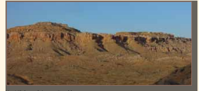
Hopidörfer auf der zweiten Mesa

Sie leben in zwölf Dörfern auf den Ausläufern oder am Fuß von drei steil abfallenden Tafelbergen aus Sandstein, die die Spanier Mesas