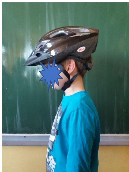
Čelada je preveč na čelu.