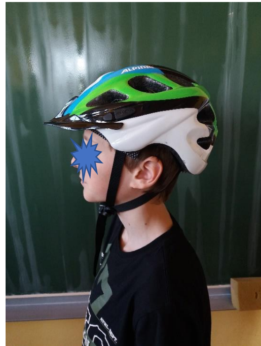
Med pasovi čelade so ušesa. Čelada je nad ušesi.