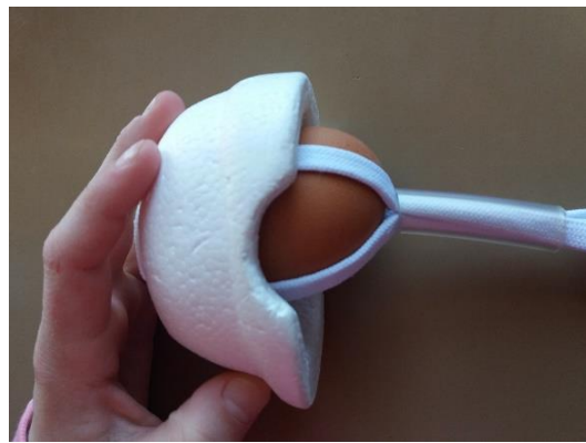
Jajce s pripeto čelado.