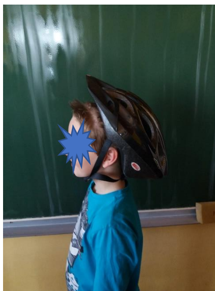
Čelada je prevelika.