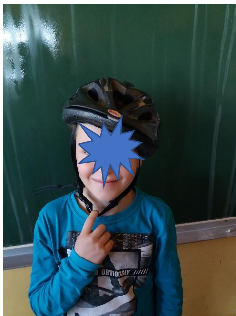
Pasovi čelade so preveč ohlapni.