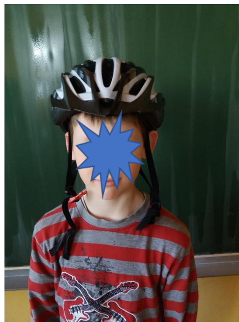
Čelada ni pripeta.