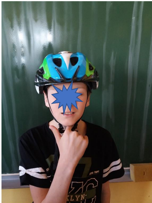
Čelada sega do sredine čela. Med pasom in brado je prostora za en prst.