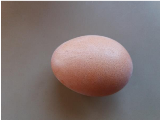
Jajce pred padcem.