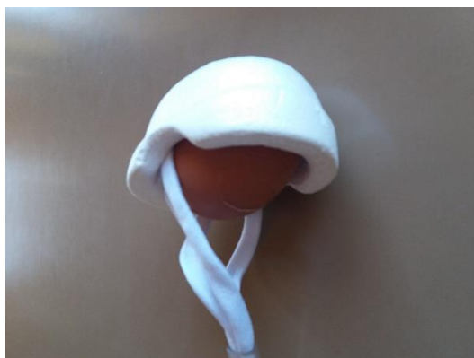
Jajce z odpeto čelado.