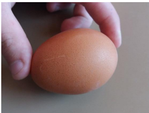
Jajce po padcu z zapeto čelado.