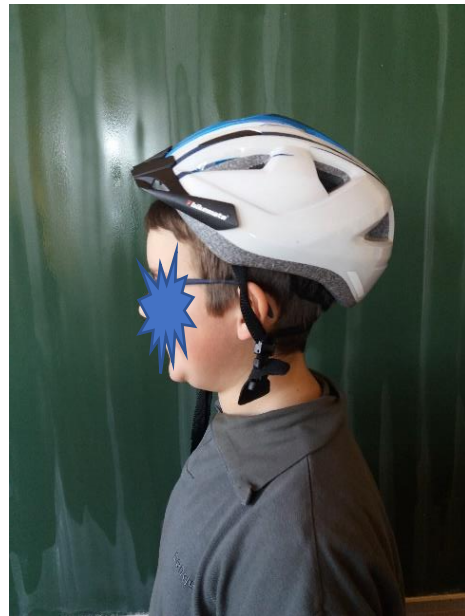
Čelada je premajhna.