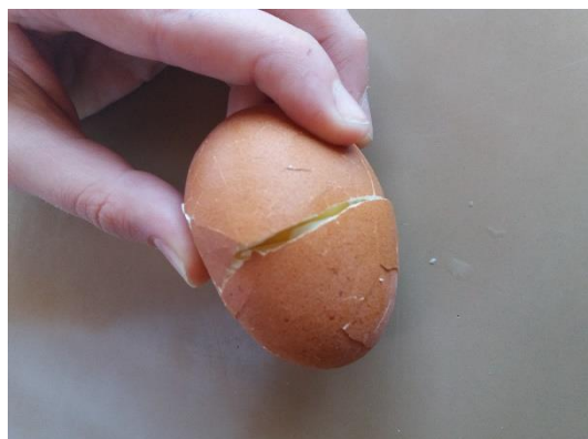
Jajce po padcu z odpeto čelado.

Učenci so ob nazornih poskusih spoznali, kako pomembna je čelada in to pravilno nameščena ter zapeta.