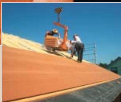
AGEPAN® THD – ideal als zusätzliche Aufsparrendämmung