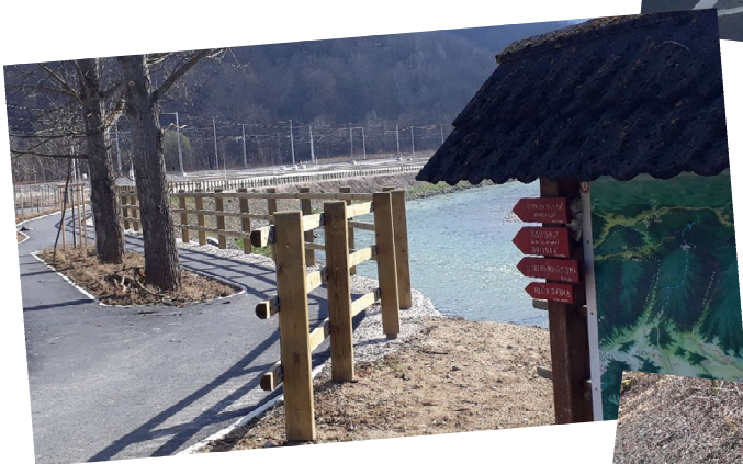
Pri krožnem križišču zavijemo desno in peljemo po poti ob reki Savinji do izliva Voglajne.

Prečkamo reko in na desni strani na manjšem parkirišču parkiramo kolesa.