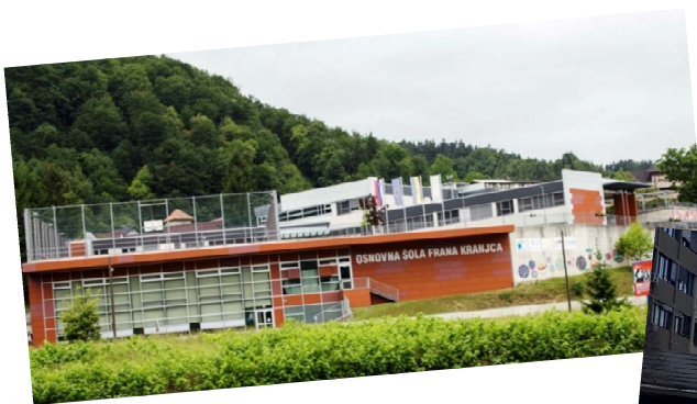
Zbirno mesto pred osnovno šolo Frana Kranjca Celje.

Izbrali smo lažjo pot, brez vzponov, tako, da je primerna za skupine manjših otrok , oziroma družine z manjšimi otroki . Povezali pa smo kolesarjenje z možnostjo pohodništva in izobraževanja .