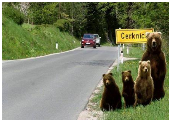
slika iz www

Kolesarska pot, je mišljena za kolesarje, ki si želijo dobro izkušnjo. Potrebno pa je sodelovanje v celi ekipi, kar prinaša novo dinamiko z razdelitvijo vlog in odgovornosti.