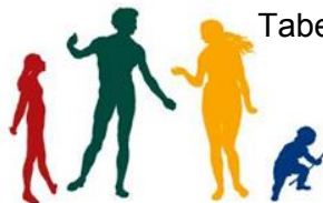
Tabela prikazuje le nekatere vrste zdravstvenih dejavnosti in skupno število storitev z vsebino obravnave 10.