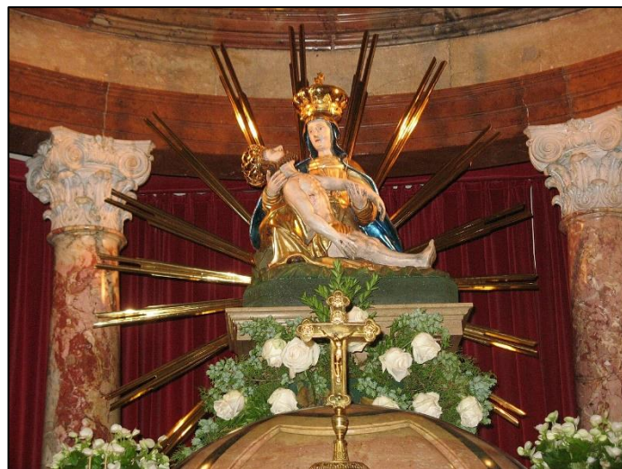
Gnadensbild Maria Lanzendorf

Anmeldungen ab sofort Freitag von 9.30-11.30 persönlich in der Pfarrkanzlei!