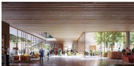
Skupni prostor, ki se odpira navzven in navznoter, podpira dejavno staranje

Odvil se je letni posvet izobraževanja odraslih Andragoškega centra Slovenije. Na spletu se je zbralo domala 400 udeležencev! Spoznanja: formalno izobraževanje s svojimi hipotetičnimi potrebami za prihodnost samo zase ni dovolj; izobraževanje odraslih je ključno - se vidi v krizah! - je način vključevanja odraslih in tudi izobraževalcev odraslih v družbo (mag. Tanja Možina, študija o digitalizaciji izobraževanja odraslih). Posvet je moderirala mag. Zvonka Pangerc Pahernik, pri tem pa poudarila vrednote posveta: humanost, odgovornost, tolerantnost. O odprtem dostopu do izobraževanja, 20-ih modelih obnašanja v digitalnem izobraževanju ipd., je razpravljala mag. Mitja Jermol (UNESCO-v mednarodni raziskovalni center za umetno inteligenco na Institutu Jožef Stefan). Presenetilo nas je razmišljanje, da naj bi se Ministrstvo za izobraževanje odslej posvečalo le izobraževanju za delo, vse drugo naj bi pripadlo področju socialnega varstva? To bi zanikalo izobraževanje vzdolž in širom življenja , temeljno doktrino, ki jo zagovarjamo, prizadelo bi splošno izobraževanje odraslih, kar bi bil usoden korak v preteklost. V krizah se pogosto priznava le tisto običajno, tisto obče, tisto vsem razumljivo, inovativne oblike in rešitve so ogrožene. Toda, ko kriza mine, bomo takrat ostali brez inovativnih rešitev? Ranljivo je tudi izobraževanje starejših, ki povezuje učenje z delovanjem v dobro skupnosti in krepitev identitete starejših v družbi.