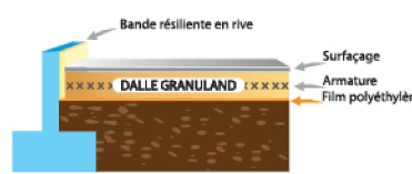
Dalle isolante sur terre plein