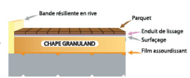
Chape sur plancher béton