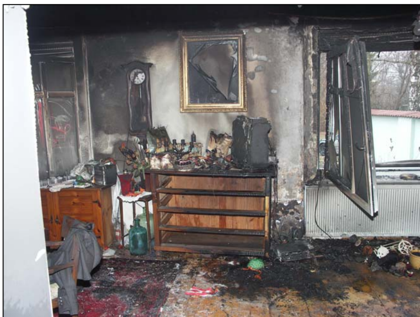
Brandeinsatz am 19. 12. 2007