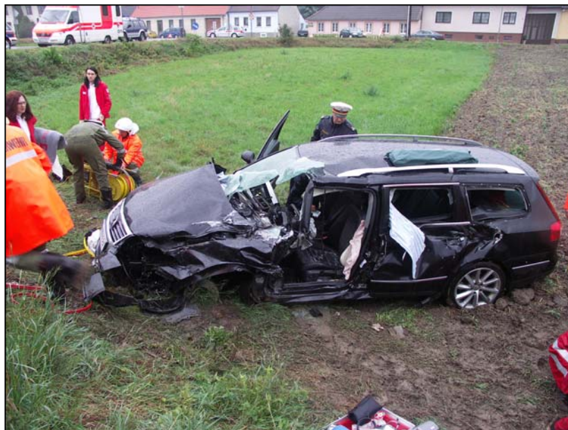
PKW Unfall mit Zug, B 40 - Eisenbahnkreuzung

Im Jahr 2007 wurde die Feuerwehr Wilfersdorf zu zwei Brandsicherheitswachen, zwei Brandeinsätzen und zu 23 technischen Einsätzen alarmiert. Weiters wurden zwei Fehlalarme ausgelöst. Die Feuerwehrmitglieder mussten somit zu insgesamt 29 Einsätzen mit 338 Einsatzstunden ausrücken. Um bei Einsätzen effizient arbeiten zu können, muss man bestens ausgebildet sein. Daher müssen sich die Feuerwehrmitglieder jedes Jahr bei Übungen und Lehrgängen weiterbilden. Im abgelaufenen Jahr nahmen 34 Mitglieder an Übungen und Schulungen mit einer Gesamtzeit von 563 Stunden teil. 12 Personen nahmen an 15 Kursen und Weiterbildungsseminaren im Bezirk sowie an der Landesfeuerweherschule in Tulln teil. Neben der Anwesenheit bei Einsätzen und Übungen haben die Mitglieder der FF